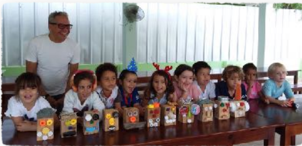
Les GS de la classe A et B