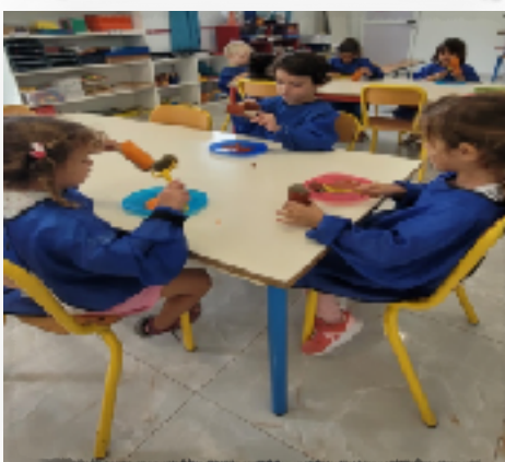
Class A / Class B